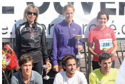
« La Gambettoise »

L'association organise depuis 6 ans une épreuve de marche, rando et course qui a lieu sur SOUES, départ de la mairie le premier dimanche de septembre :