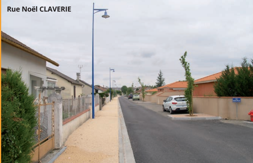
Rue Noël CLAVERIE