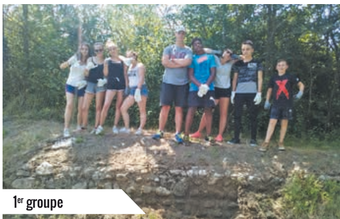
1 er groupe

Tout le groupe a apprécié cette expérience de chantier, la très bonne ambiance générale a permis de découvrir le monde du travail et la vie de groupe dans d'excellentes conditions!