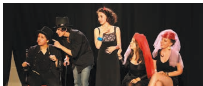
Les jeunes acteurs de l'atelier Récré-activité de Soues