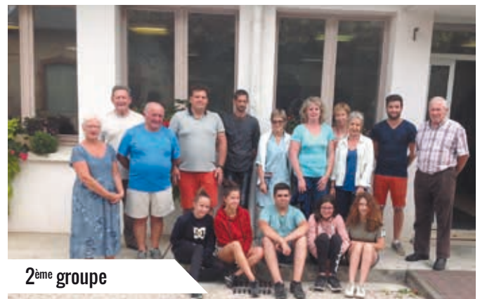
2 ème groupe

Ces chantiers se sont inscrits dans un projet d'auto-financement pour un voyage à Paris. Perspective qui a motivé cette belle jeunesse !