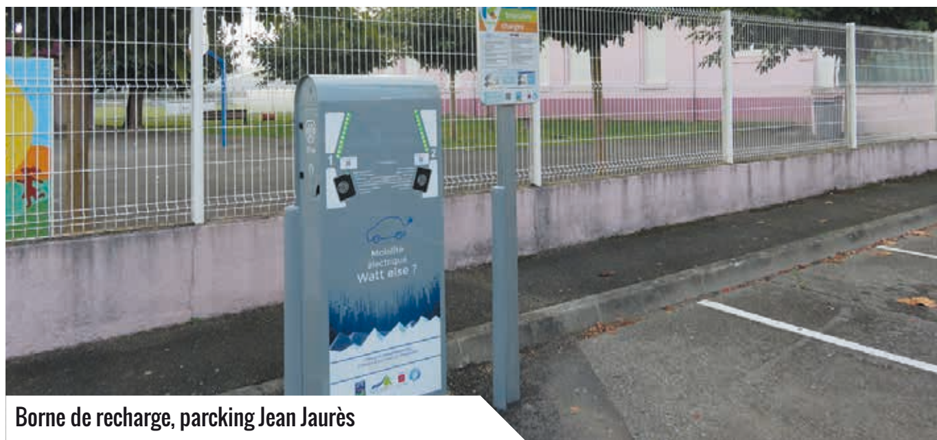
Borne de recharge, parking Jean Jaurès

Le coût moyen pour 100km est de 3€ pour un véhicule électrique, contre 8€ pour un véhicule thermique (diesel, essence) !